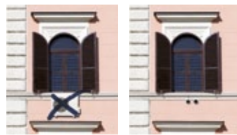
CLASSIC SYSTEM UNICO

La tecnologia brevettata di Unico ha reso possibile compattare in un'unica unità ciò che tradizionalmente è diviso in due, motore esterno fuori e split dentro, nel pieno rispetto dello spirito originario degli edifici, nella totale integrazione architettonica e con una notevole semplificazione progettuale. All'esterno dell'edificio si vedono solo due griglie per l'aspirazione e l'espulsione dell'aria.