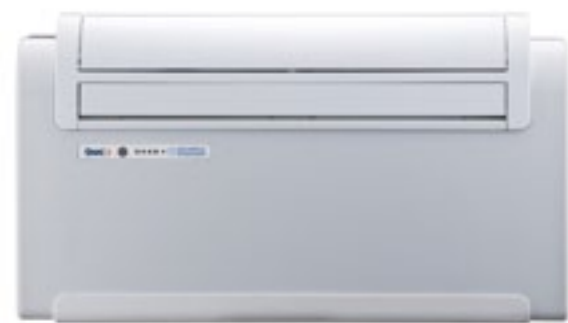
UNICO INVERTER 9 SF COD. 01068 UNICO INVERTER 9 HP COD. 01060 UNICO INVERTER 12 SF COD. 01067 UNICO INVERTER 12 HP COD. 01052